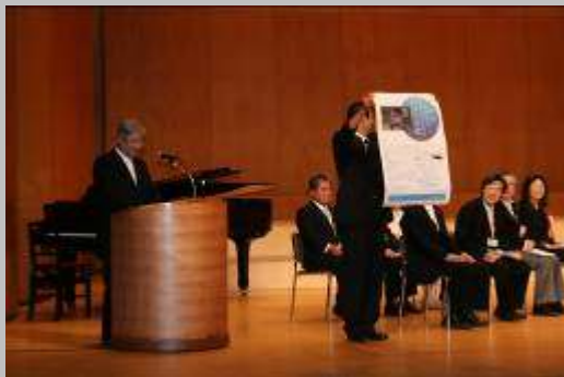
*両国文学賞の紹介*