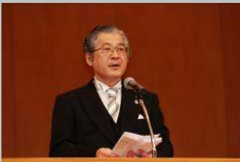
*大平校長先生の式辞*