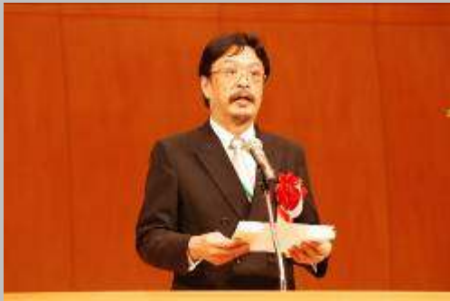
*今井後援会会長の祝辞*