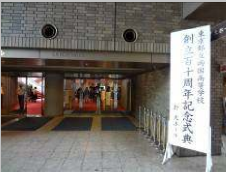
*江戸川区総合文化センター*